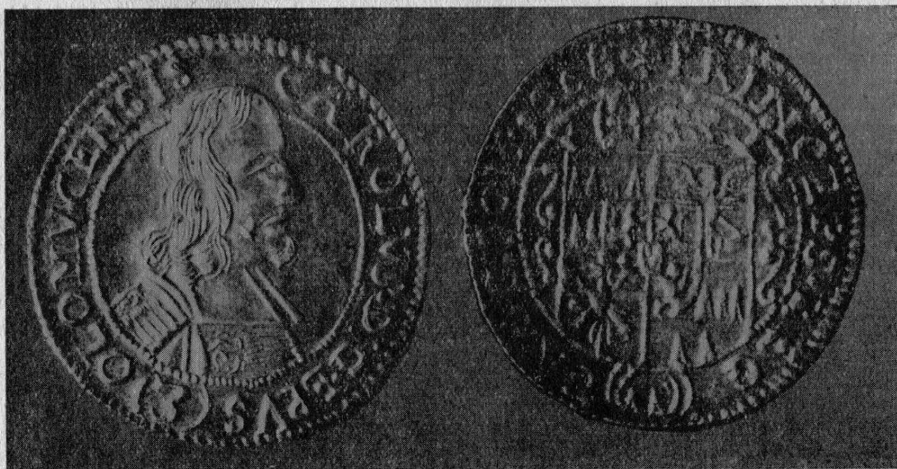
Slavonín, věž kostela: Tříkrejčary Karla II. z Liechtenštejna (1664—1695) z mincovny v Kroměříži. Zvětšeno.