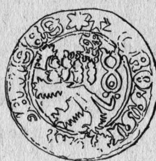
Litovel, nález mincí z třicetileté války: Pražské groše Vladislava II. (1471—1516), typy Háskova XI. a/7 var. (popis č. 5), XIII. e/2 var. (popis č. 7). Skutečná velikost. Kresba V. Burian.