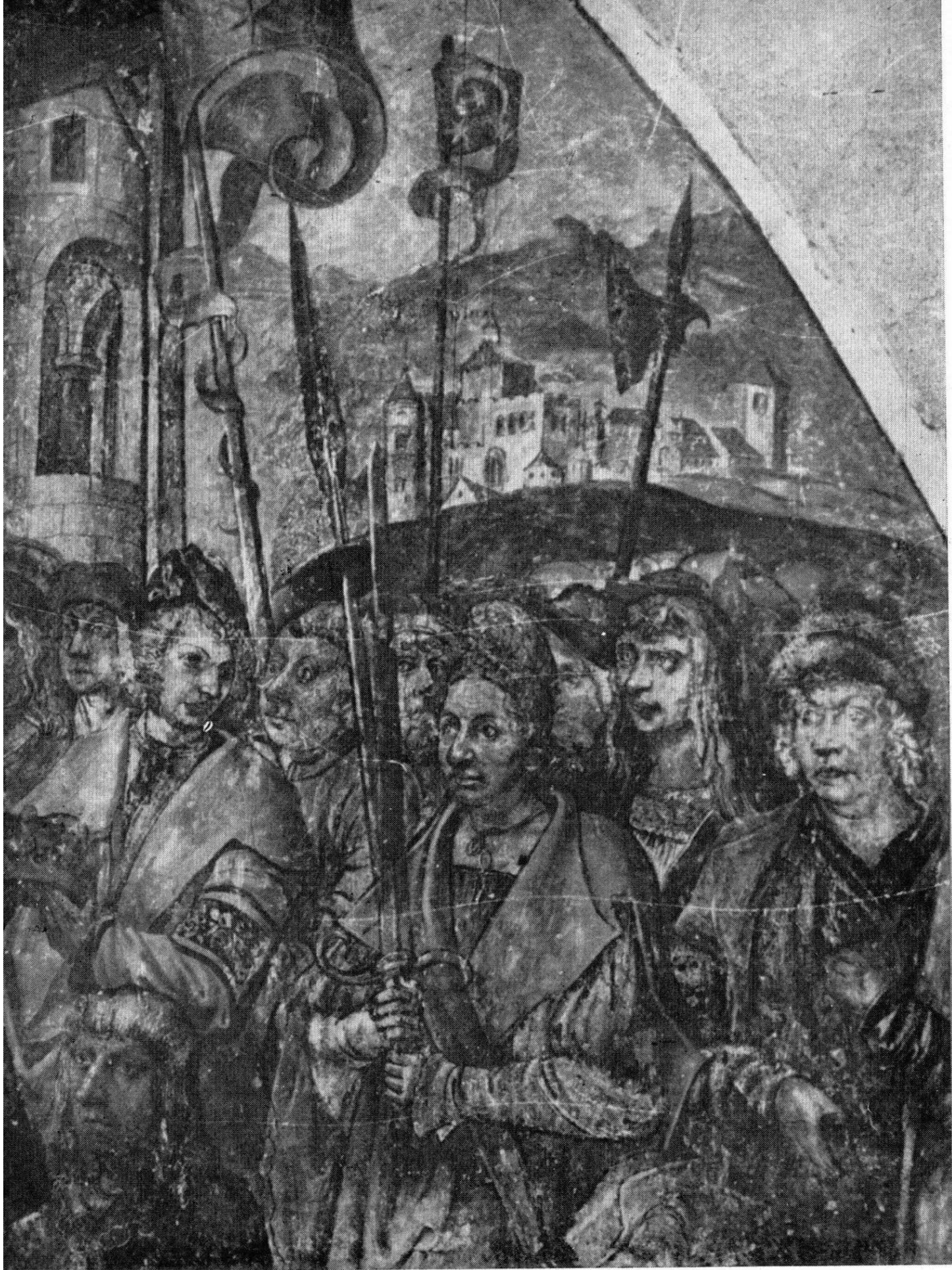
Olomouc, dóm, křížová chodba: Výřez nástěnné malby Klanění s předpokládaným zobrazením kostela sv. Mořice z počátku 16. století.

[V. Kupka, Dosud neurčené zobrazení kostela sv. Mořice (?) na nástěnné malbě z počátku 16. století z křížové chodby olomouckého dómu]