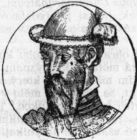
Francisco Pizarro (str. 463)