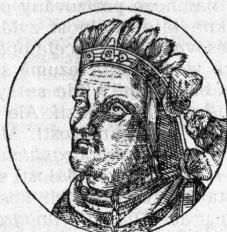
Atahualpa (Atabalipa). král Peru (str. 463)

Rytinové portréty španělských conquistadorů a indiánských vládců Mexika a Peru v Opmeer-Beyerlinckově Opus Chronographicum, Antverpy 1611.