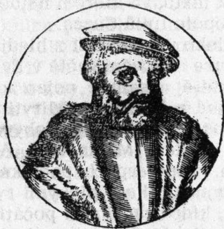
Ferdinand Cortés (str. 455)