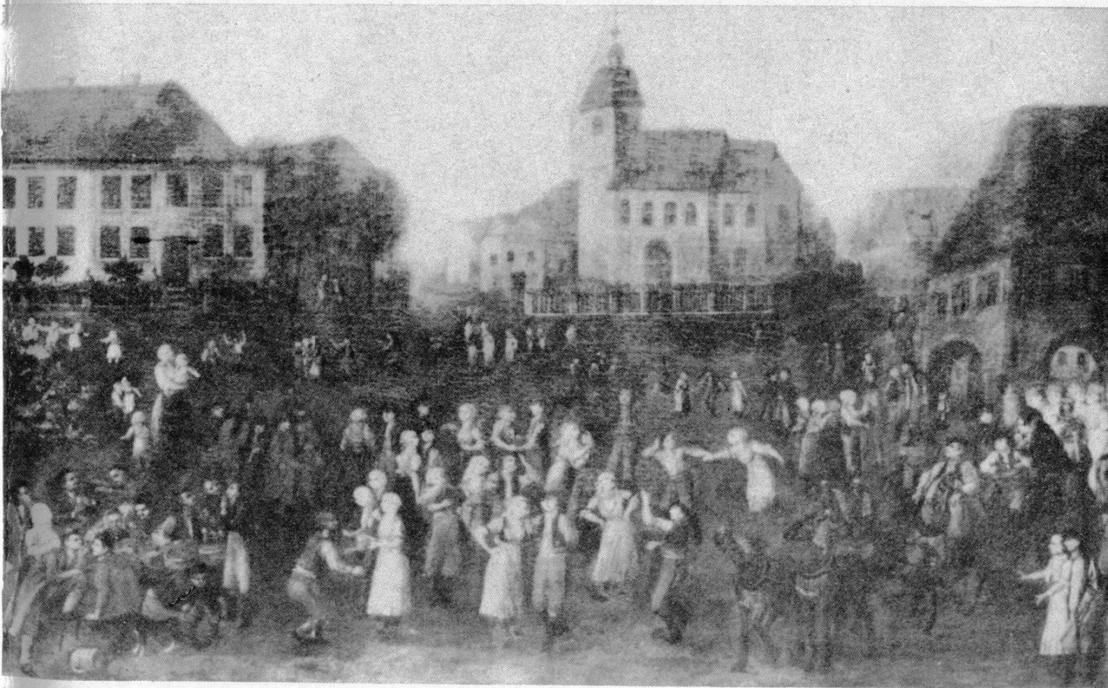
„Zámek v Náměšti na Hané“, „Starohanácká svatba“, neznámý malíř z 1. pol. 19. století (detail obrazu na 4. straně obálky).