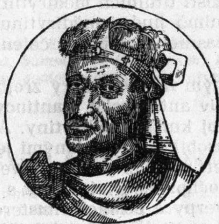
Montezuma (str. 455)