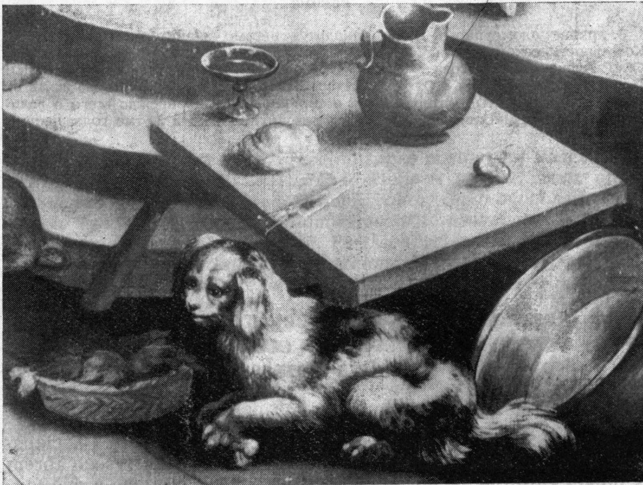
„Večeře v Emauzích“ (detail), okruh mal. rodiny Bassanů, 1. pol. 17. století.

Na této činnosti se v plné míře, kromě jiných úkolů, podílí také Vlastivědný ústav v Olomouci. Jednou z nejdůležitějších oblastí, kde se uplatňuje státní památková péče, jsou instalované památkové objekty ve správě Vlastivědného ústavu — hrady Bouzov, Šternberk a zámek v Náměšti na Hané. Staly se neodmyslitelnou součástí krajiny i života olomouckého okresu a vysoká návštěvnost, která rok od roku narůstá, toto sepětí potvrzuje. Tím větší zodpovědnost spočívá na Vlastivědném ústavu, jakým způsobem prezentuje tyto objekty, jeho sbírky, jakým způsobem spojuje činnost na historickém objektu se současnými požadavky na rozvoj kultury.