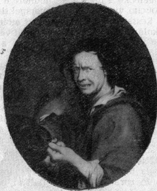
„Veselý piják“ a „Smutný piják“, holandský malíř 17. století (kopie). Opravovaly E. Jarošová a J. Tesařová.