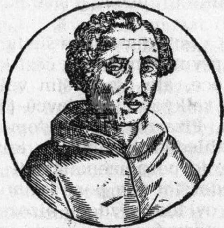
Kryštof Kolumbus (str. 437)