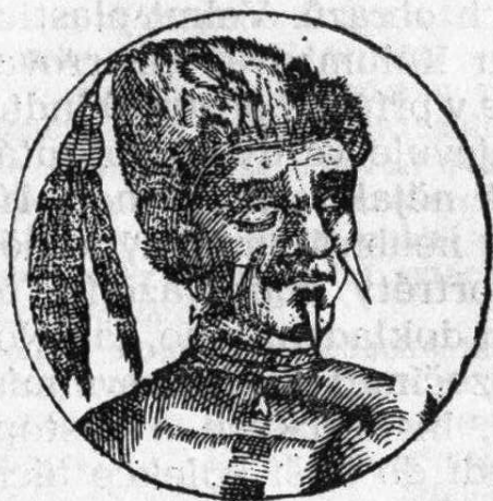
Mexický král (str. 455)