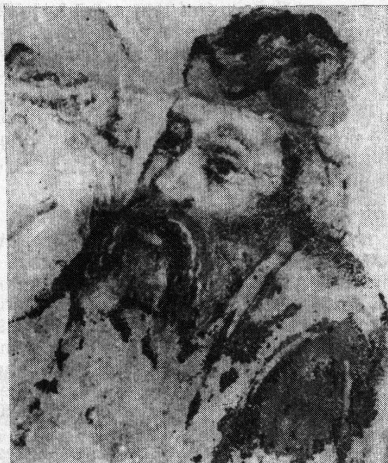
Šternberk, zámek: Detail nástěnné malby s předpokládaným portrétem Karla IV. (1371 až 1375).