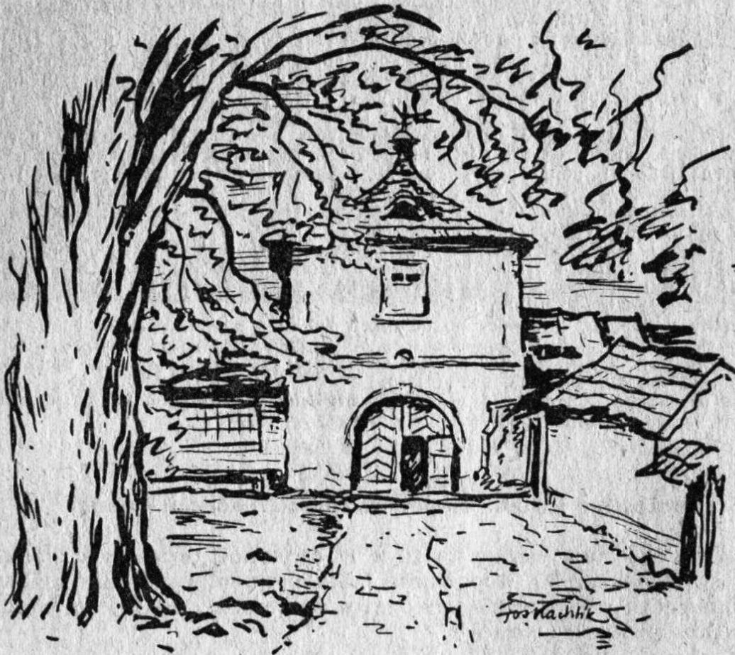
Zámek Troyerstein v Rychtářově (o. Vyškov).