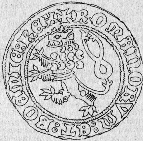
Dukát Karla IV. (1346—1378). Kresba Václav Burian.