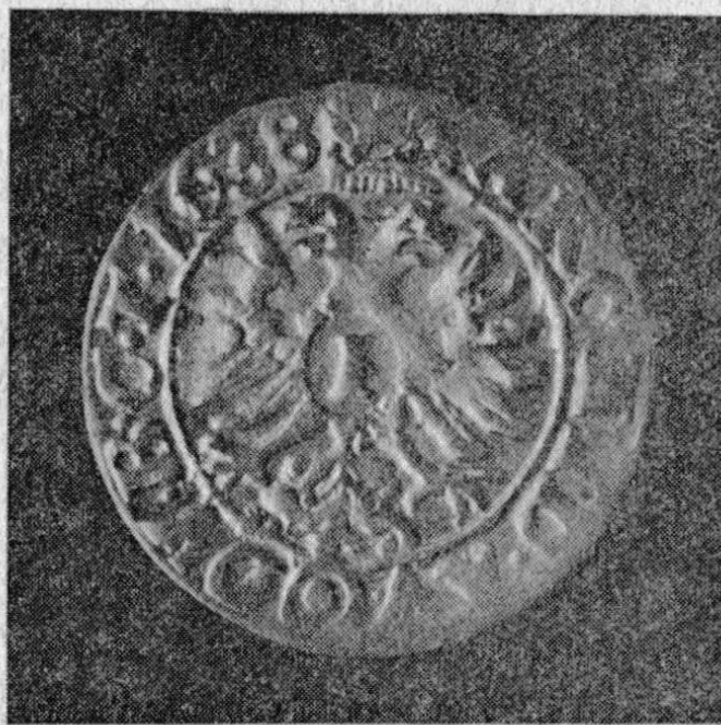
Krejcarey Ferdinanda II. (1620—1637), ražené v olomoucké mincovně (1628, 1638); z hromadného moravského (?) nálezu.