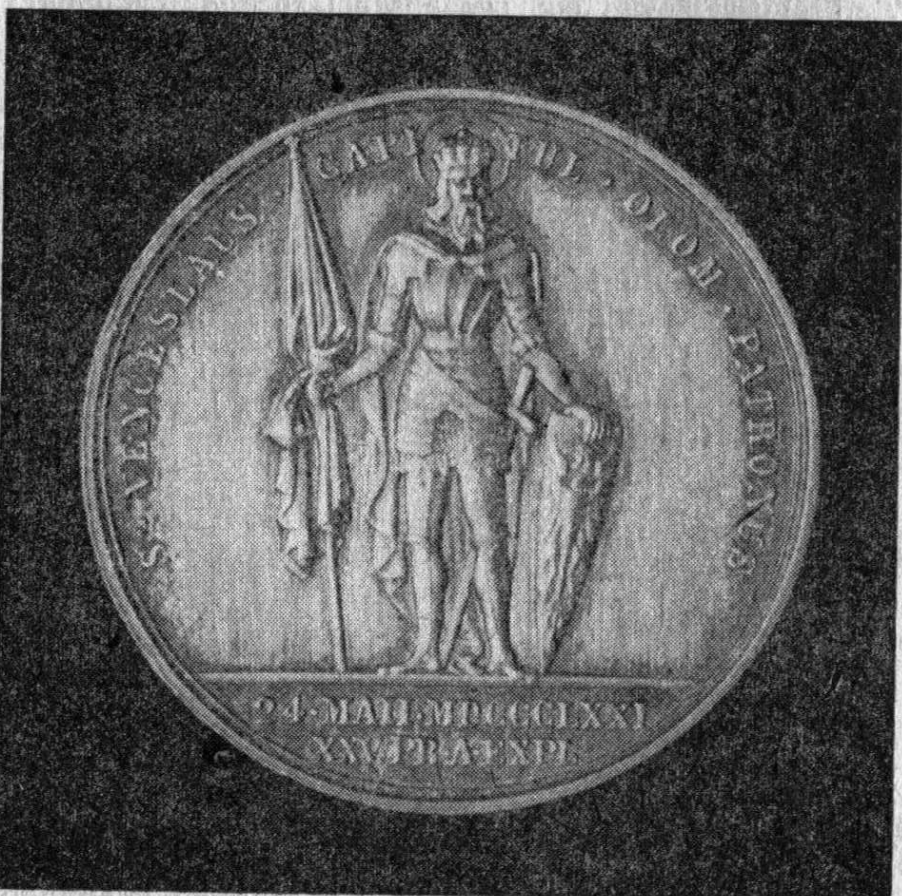
Pozdněgotická plastika sv. Václava, pův. na průčelí katedrály v Olomouci.