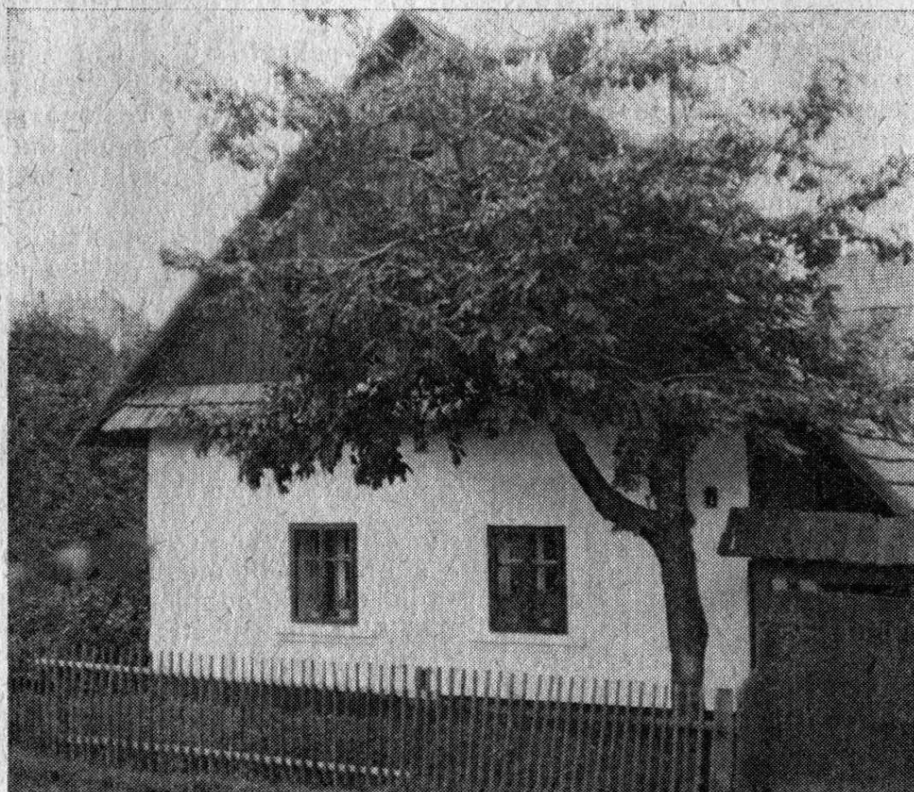
Brodek u Konice, o. Prostějov. Usedlost č. 136, srpen 1981.

Vystěhování Němců probíhalo bez rušivých momentů, nebyly zaznamenány přestupky proti nařízení týkajících se množství a sortimentu vyváženého majetku. Němci z Brodecka patřili ve své většině k sociálně slabé vrstvě obyvatelstva. Často považovali za nejvýznamnější majetek své domácnosti šicí stroj, který jim i bez řemeslnického osvědčení umožňoval doplnit výdělek z malého hospodářství a zachovat existenční minimum. V archívních materiálech nalezneme šedesát zamítnutých žádostí o vývoz šicího stroje. Jejich majitelé s největší