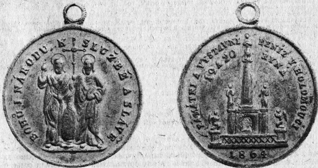
Medaile hospodářské výstavy v Olomouci r. 1864.

Obratme nyní pozornost k pamětní medaili, ražené k této významné české události v Olomouci, která je svědectvím velkorysosti pořadatelů a dnes i sběratelskou zvláštností. Nutno mít na zřeteli, že událost časově spadala do okruhu cyrilometodějského milénia, což ovlivnilo aversní tematiku pamětní ražby, která byla provedena stejným razidlem jako medaile na slavnosti svěcení praporů spolků Haná ve Vyškově 17 a Orlice v Prostějově, 18 konaných 11. září, tedy krátce před olomouckou výstavou. Na všech těchto medailích je zobrazeno známé Maxovo 19 cyrilometodějské sousoší s týmž opisem. Vidět zde tedy dobový národně politický záměr, ovlivněný nejspíše poslancem Ignátem Wurmem, 20 předákem směru staročeského konzervatismu. Rub medaile zobrazuje objekt, který vykladače medaile dosud tolik mátl: morový sloup, v tomto případě symbol Olomouce — mimochodem poměrně snadno rytecky proveditelný, neboť i náročnost rytecké práce a s tím spojené finanční náklady rozhodovaly při podobných objednávkách (stejný účel mělo také opětne použití aversního razidla). Vlastní posláni medaile naznačuje především reversní opis, hýřící sice svéráznou gramatikou, ale přesto dosti jasně informující o výstavě v Olomouci 19.—20. října 1864, čímž tedy nutno rozumět hospodářskou výstavu, nikoli výročí morového sloupu. Také obě předchozí medaile (vyškovská a prostějovská) se v opisech vyznačují zvláštnostmi, směřujícími ke stejnému výrobcí.