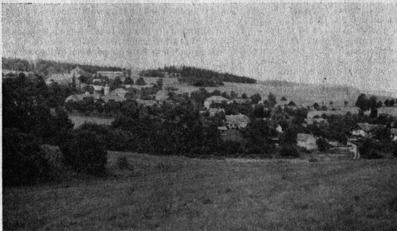
Lhota u Konice, o. Prostějov. Celkový pohled z jižních svahů od Labutic, srpen 1981. Snímek autor.

Po mnichovském diktátě následoval zábor českého pohraničí, do kterého původně nenáležel brodecký ostrov Němců. Jeho představitelé však intervenovali a 19. října 1938 vydali pamětní spis, v němž historickými, sociálními, kulturními a etnickými argumenty zdůvodňovali svůj požadavek na připojení k Německu. 8 Na základě dalších územních úprav vstoupila 25. listopadu 1938 vojska wehr-