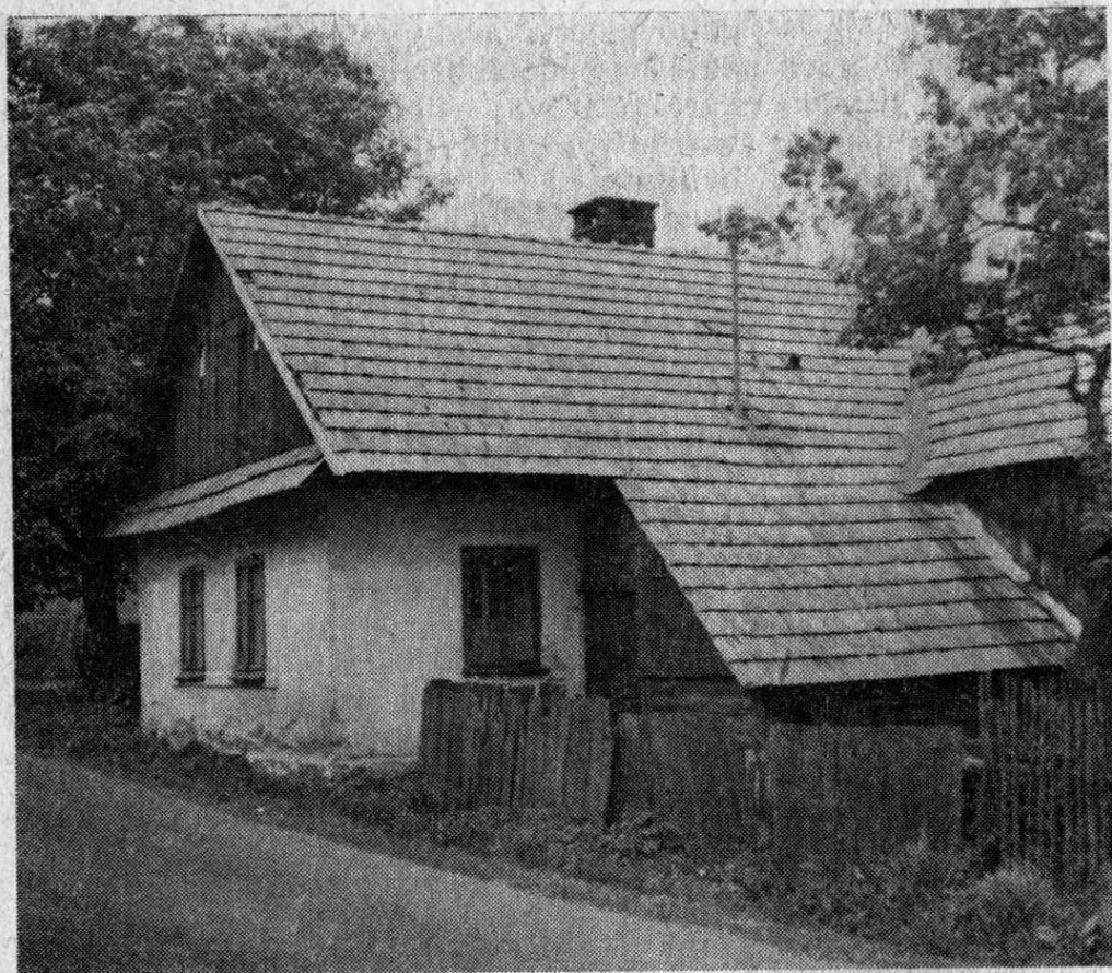
Brodek u Konice, o. Prostějov. Usedlost č. 136, srpen 1981. Snímek autor.

machtu do německých obcí, které byly přes katastrální území několika českých obcí spojeny se zabraným pohraničím. 9 4. prosince 1938 proběhly volby do říšského sněmu a svými kladnými hlasy vyjádřila většina obyvatel souhlas s připojením k Německu. Například v Runářově bylo zapsáno do voličských seznamů 425 osob a pouze 10 Čechů — starousedlíků bylo proti anexi. 10 Němci brodeckého ostrova se s různou mírou aktivity podíleli na rozbití Československa a jejich účast nemohla být opomenuta při závěrečném účtování po porážce hitlerovského Německa.