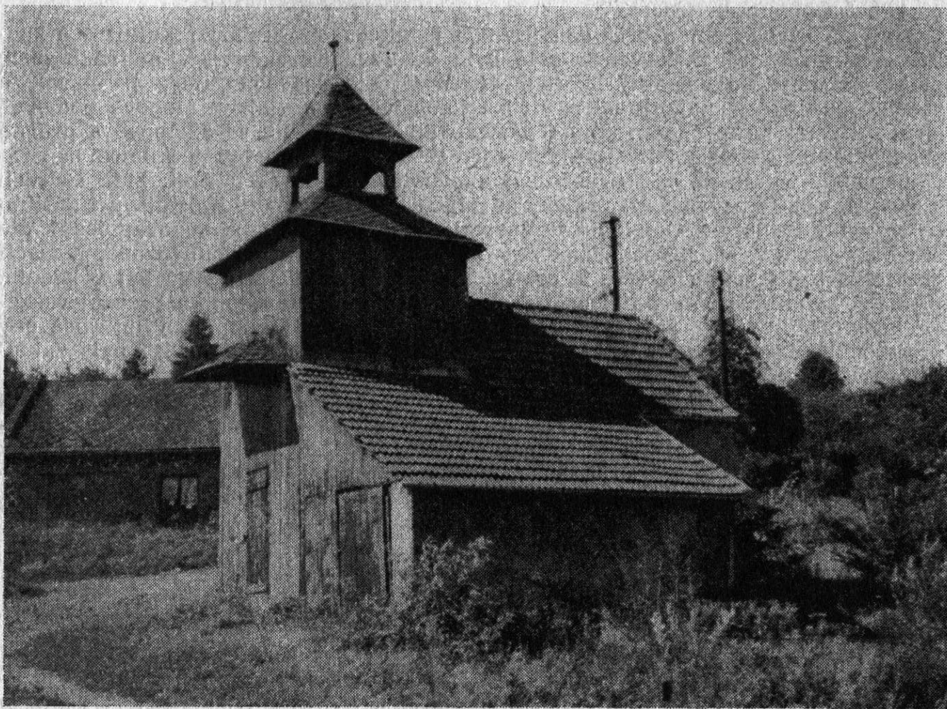
Runářov, o. Prostějov. Kaplička se zvonící, srpen 1981.

Pamětníci vzpomínají na vzájemný vztah Němců a českých osídlenců. Většina Němců se již smířila se svojí situací, někteří hospodáři radili národním správcům v zemědělských pracech, kde co mají zaset, nabízeli dlouholeté zkušenosti. Byla zaznamenána i taková situace, kdy Němec vybídl známého Čecha k osídlení