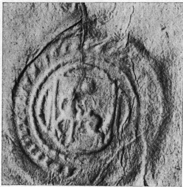
4. Kruhová pečeť města Ostravy, 1620—1668 popis pečetí, č. 3, str. 30

Vyobrazení 1—8 na stranách obálky patří k článku V. Kejly: Pečeti města Ostravy ve fondech olomoucké pobočky SOA Opava, str. 29—32