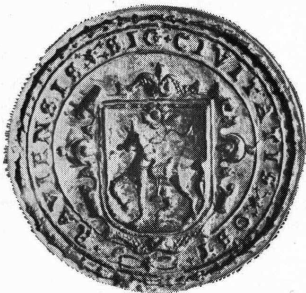
5. Typář kruhové pečeti města Ostravy, 1651—1685 Popis pečeti, č. 4, str. 30

Diese Studie behandelt Siegel, die in den Fonds der Olomoucer Zweigstelle des Staatlichen Gebietsarchivs aufbewahrt sind. Es ist dem Autor gelungen, einige neue Informationen herauszuforschen, die die Datierung und zugleich die Benutzung etlicher Siegel präzisieren. Es waren gleichzeitig zwei Exemplare entdeckt, die die bisherige Literatur nicht kennt (Nr. 2, 6).