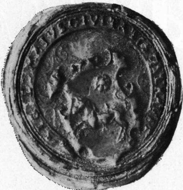
1. Kruhová pečeť města Ostravy, 1575—1615 Popis pečetí, č. 1, str. 30