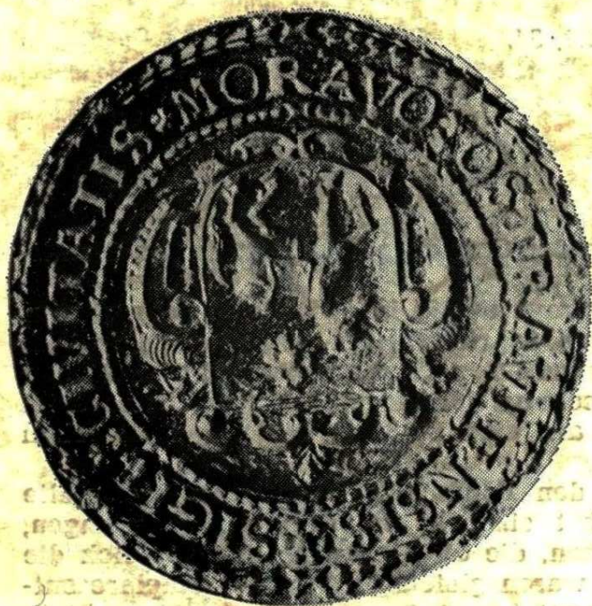
7. Typář kruhové pečeti města Ostravy, 1686—1838 Popis pečeti, č. 7, str. 31