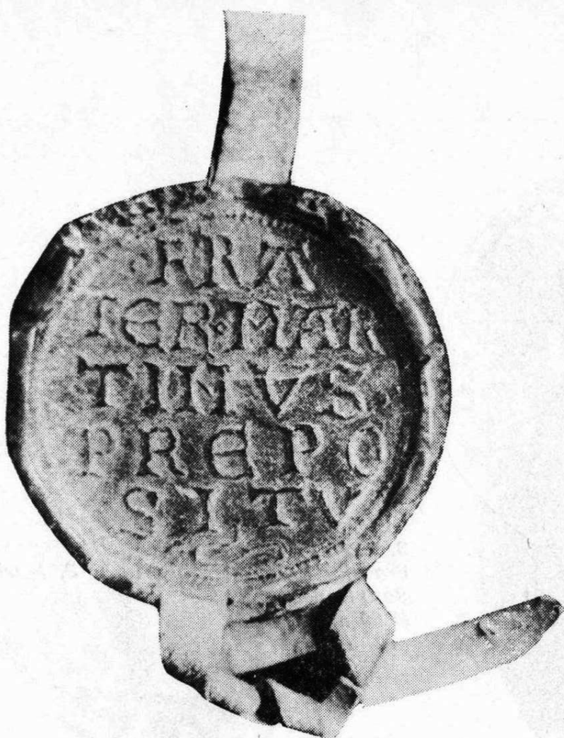
1. Martin, preceptor johantů Soupis pečeti, č. 1 Ø 29 mm