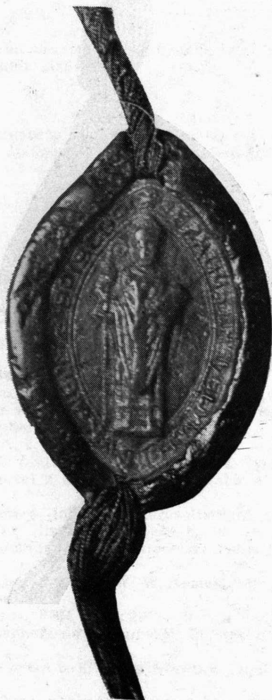
5. Gottfried, plebán v Německém Brodě Soupis pečetí, č. 16 35×23 mm