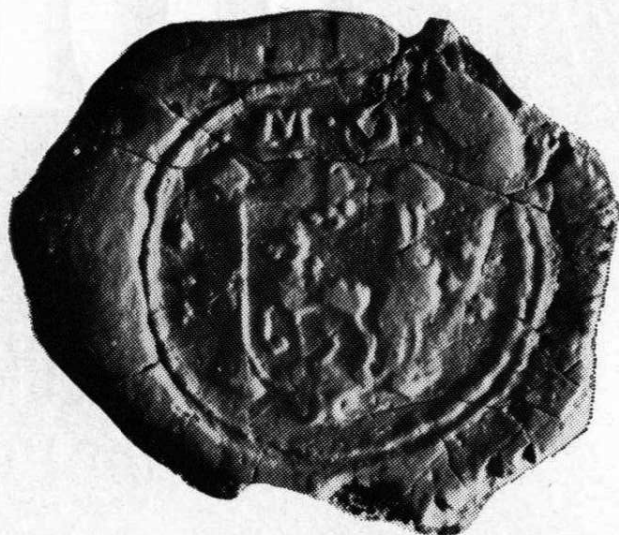
2. Kruhová pečeť města Ostravy, 1667—1803 Popis pečetí, č. 6, str. 31