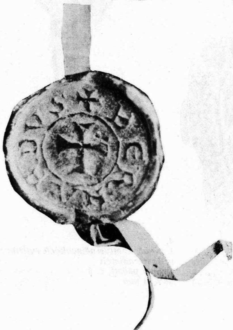
2. Bernard, převor johanitů Soupis pečeti, č. 2 Ø 26 mm