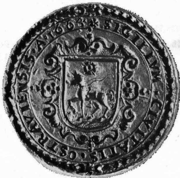
6. Typář kruhové pečeti města Ostravy, 1665—1706 Popis pečeti, č. 5, str. 31