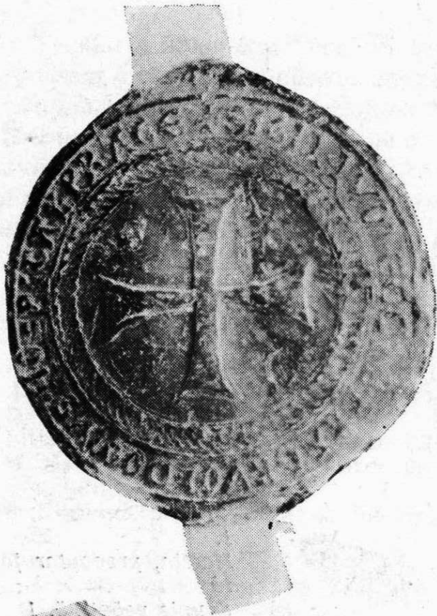
3. Pražský konvent johanitů u P. Marie Soupis pečeti, č. 5 Ø 50 mm