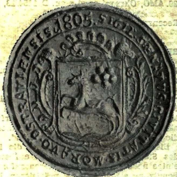
8. Typář kruhové pečeti města Ostravy, 1805—1835 Popis pečeti, č. 8, str. 32