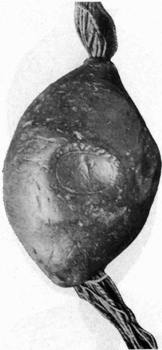
7. Anselm, varmijský biskup Soupis pečeti, č. 17 a-sekret