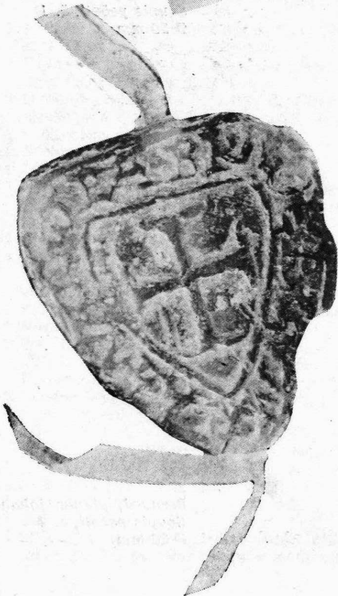
4. Konrád, komtur německých rytířů v Hostěradicích Soupis pečeti, č. 9 38×33 mm