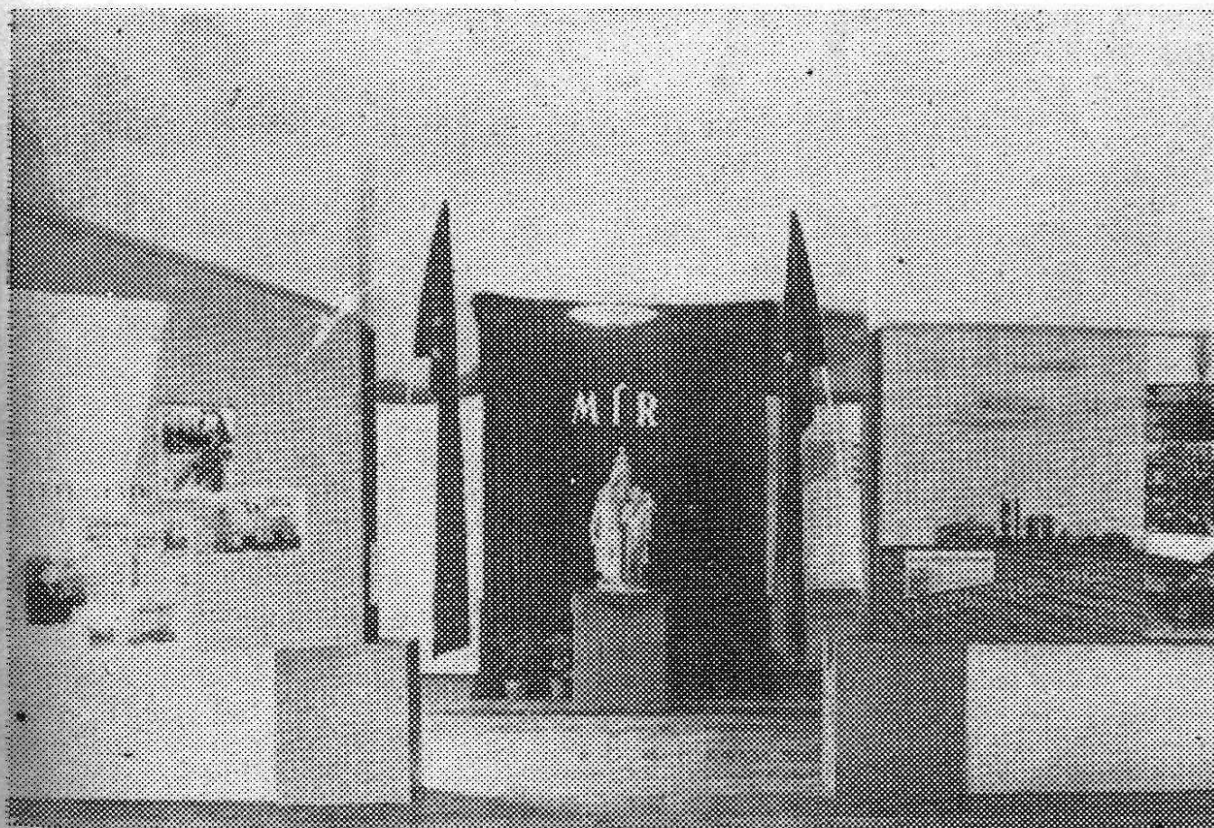
Výstava 30 let KSČ: Vyvrcholení výstavy.